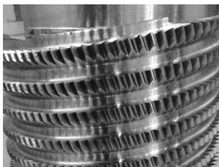
Werkstück mit verdrehter Spannute