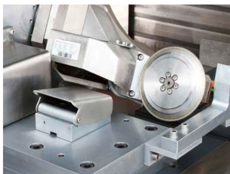
CNC-Schwenkabrichter mit Rolle