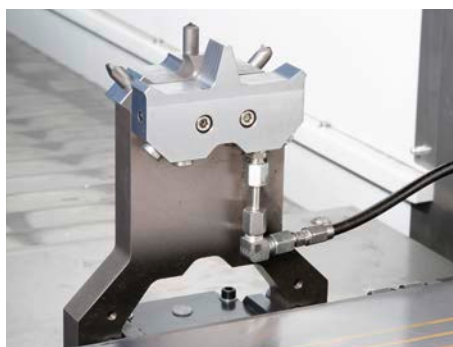
Klappabrichter mit bis zu drei Einzeldiamanten