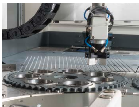
Roboterzelle für automatische Be- und Entladung