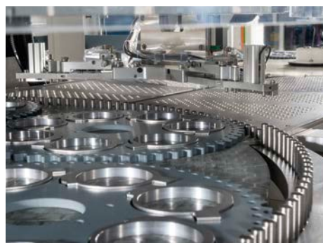
Blick vom Prozessbereich in den Twin Loader – für kürzesten Läuferscheibenaustausch