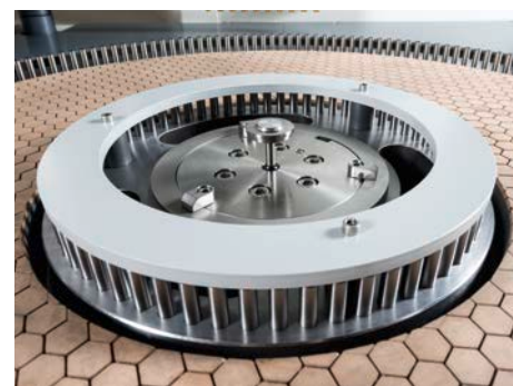
Berührungslose Messsteuerung für höchste Abschaltgenauigkeit